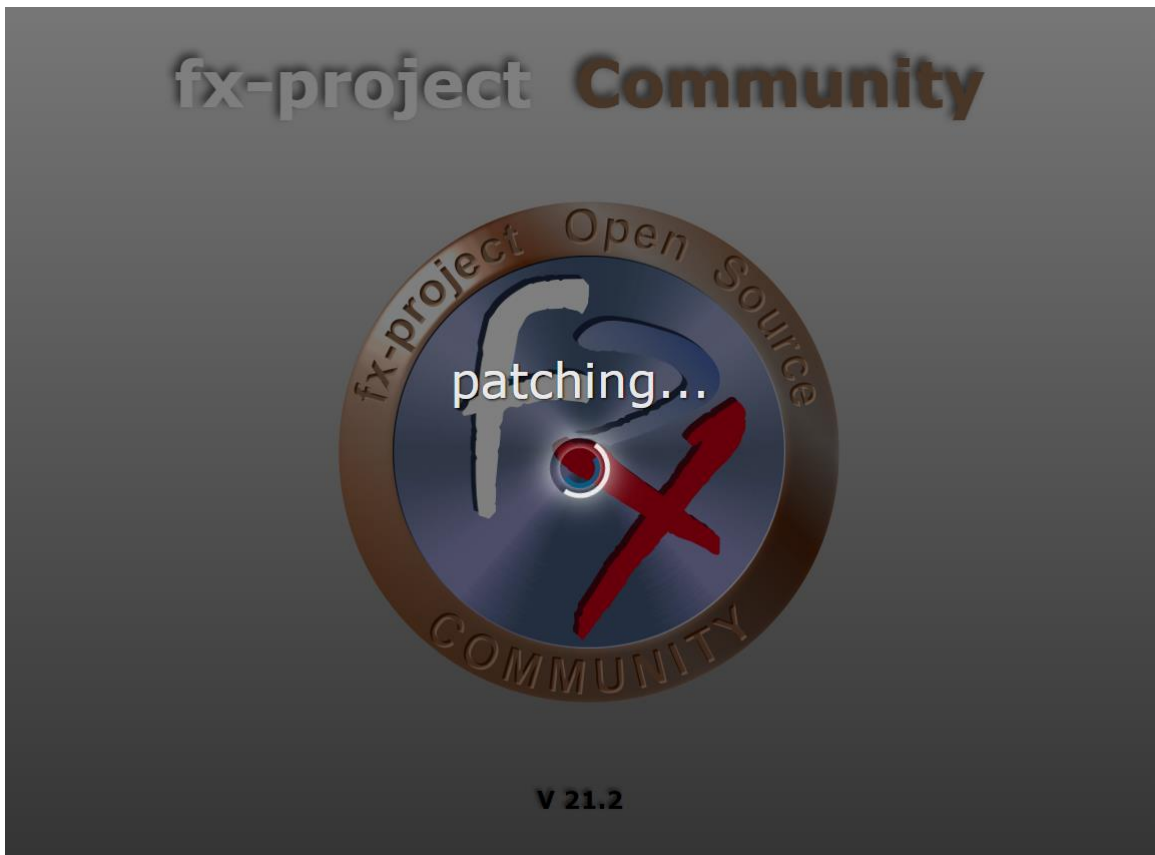
(Abbildung 3: Der Screenshot kann je nach Version abweichen)

Es werden die notwendigen Datenbankänderungen durchgeführt.